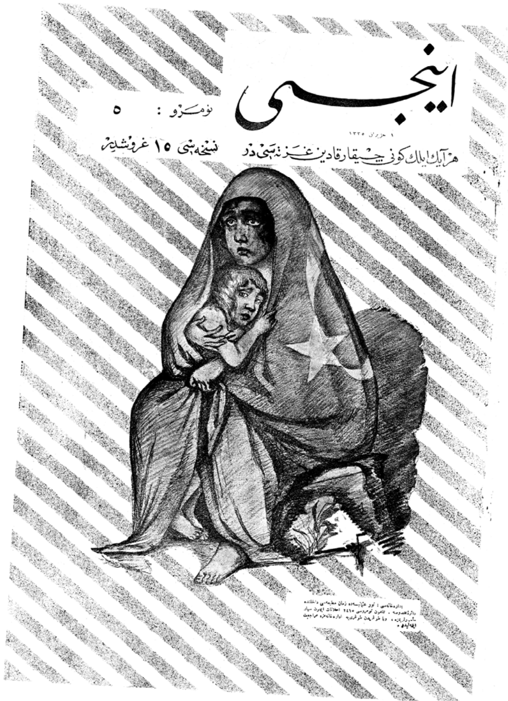
Figure 1. Cover page depicting a child and a mother embraced by a Turkish flag. Cover page, İnci , no:5, 1 Haziran 1335