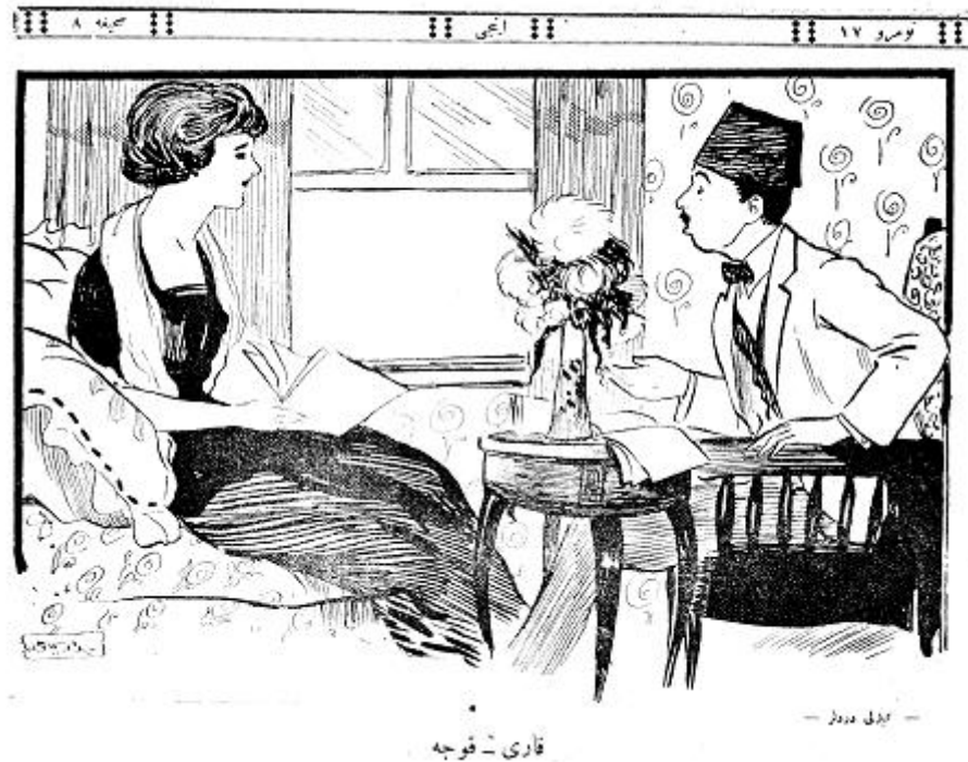
Figure 3. An illustration depicting a couple having conversation. İnci , no:17, 1 Haziran 1336, p.8