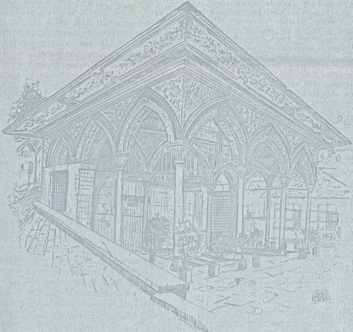
Beykoz İshak Ağa Çeşmesi Kebiri (Resim : Bülend Şeren)

Vak'anüvis Efendi bunu yazarken korkunç bir hata işlemiştir; Nevresin yazdığı tarih manzumesi çeşmenin üstüne hiçbir vakit kon-