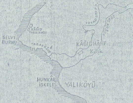
Beykoz Kâğıdhânesi (Moltke haritasından)

İlk Türk kâğıd fabrikası, Beykoz kâğıdhâ-