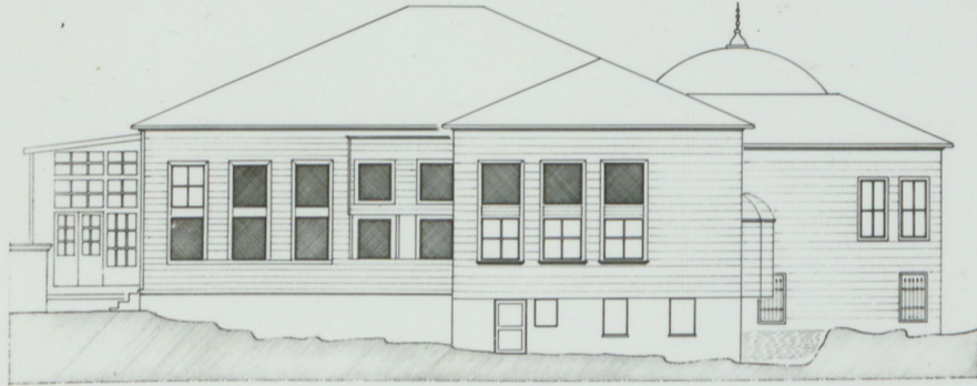
SAG YAN CEPHESI