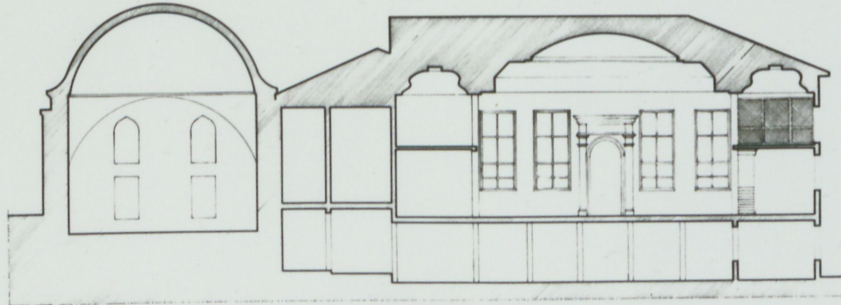
A-A' UZUNLUĞUNA KESİT