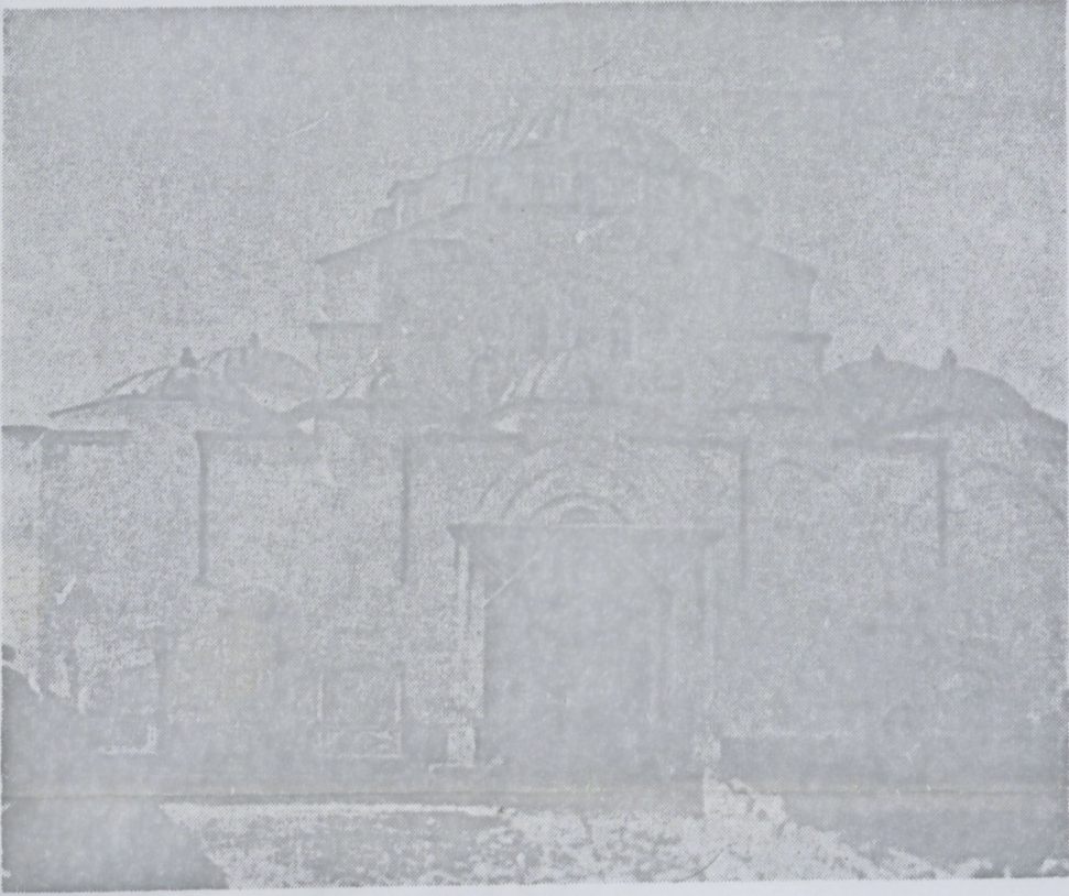
Resim 11 — Kırım Gözleve Câmiinin cepheden görünüşü.

Sinan'ın Kırım'a gittiği ve orada bir cami yaptığı bugüne kadar pek az bilinen ve hattâ memleketimizde hemen hiç bilinmeyen bir gerçektir.