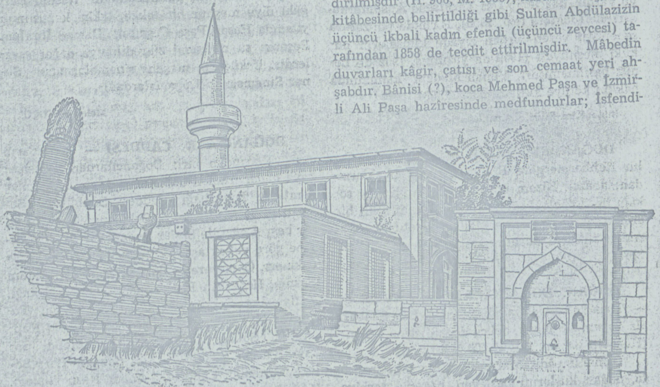
Doğancılar Camii ve İzmirli Ali Paşa Çeşmesi