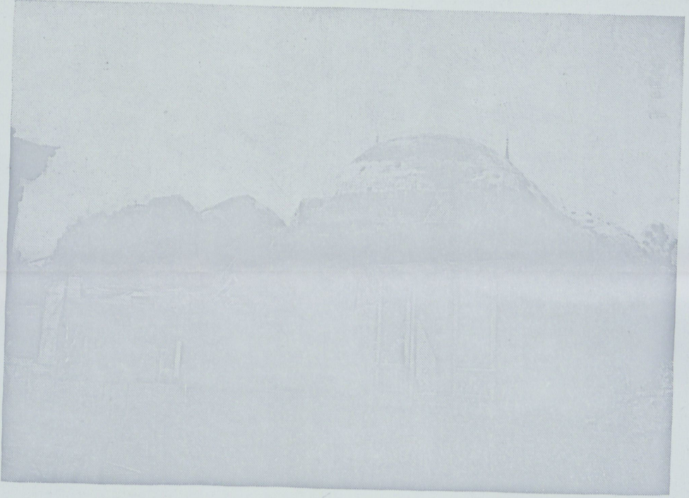
Yeşil Direkli Valide Sultan Hamamı böyle idi.

Hamamların kapıları batıya doğru açılırdı. Bu hamam Yeşildirekli Hamam ; Valide Sultan Hamamı , Çarşı Hamamı , Atik Valide Sultan Hamamı , Büyük Hamam gibi adlarla anılmıştır.