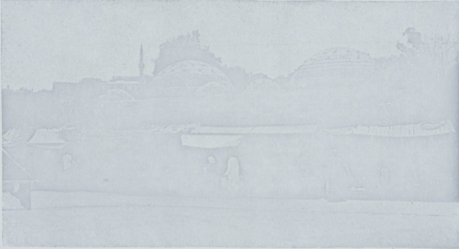
Yeşil Direkli Valide Sultan Hamamı (60 yıl önce).

Sultan III. Murad 'ın anası, Sultan II. Selim 'in karısı Nurbânû Sultan Üsküdar 'da Atik (eski) Valide külliyesini 991 H. 1583 M. yılında yaptırdığına ve hamam da onun vakfının gelirlerinden olduğuna göre, bu ha-